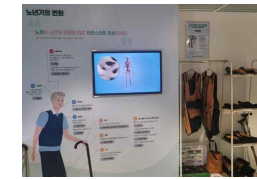
15 노인 체험