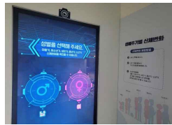
11 생애주기별 신체 변화 체험