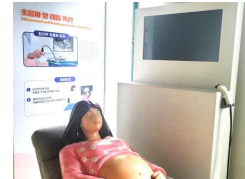
13 초음파 및 태동 촉진 체험