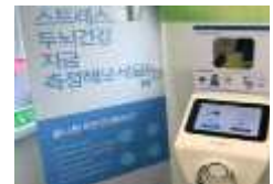
5 스트레스 측정기