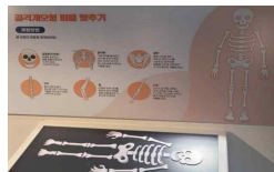
8 골격 퍼즐