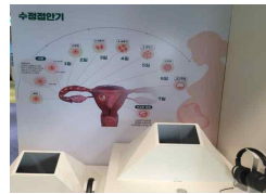
12 수정 접안기