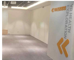
10 인터랙티브 플로어