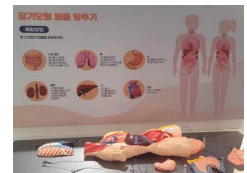
7 장기 퍼즐