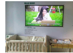
14 신생아 돌보기