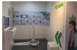
6 전신 스캐너