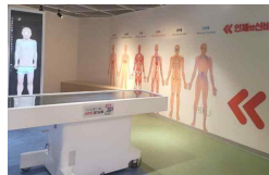
9 3D 해부대, 벽면 교구(신체)